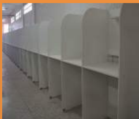
Colocação de baias de estudo