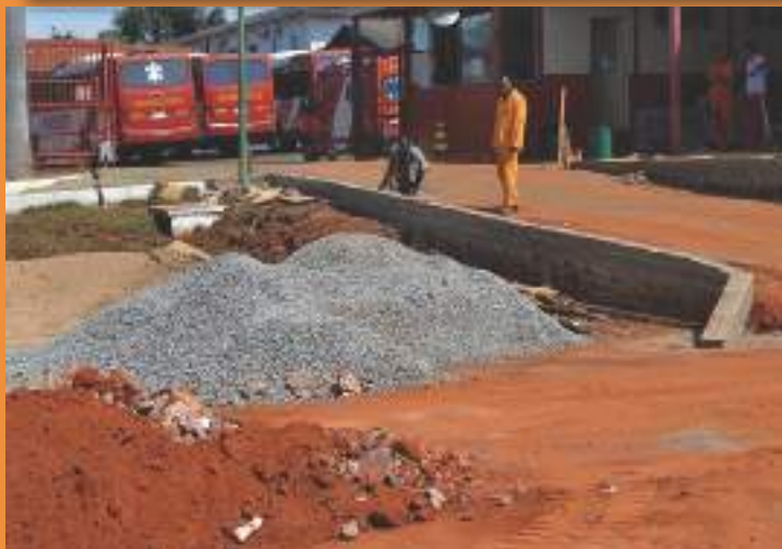
Ampliação da rampa de acesso na entrada do CMDPII