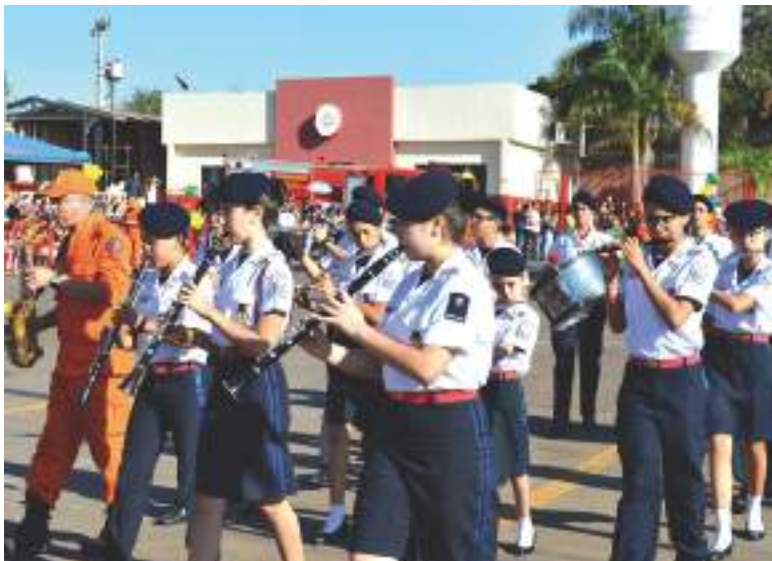
Banda de Música do CMDP II