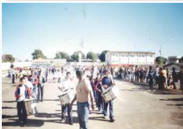
Começo da Banda de Música