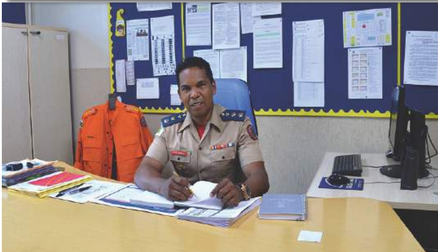
Gabinete do Comando CMDPII