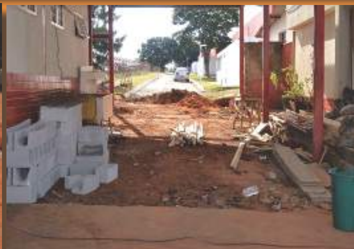
Ampliação das instalações do Corpo da Guarda do CMDPII