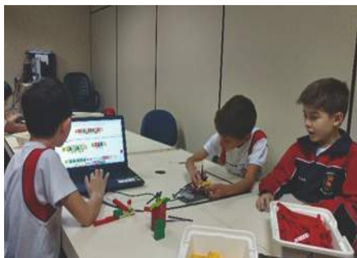
Ajuda na organização de modo geral