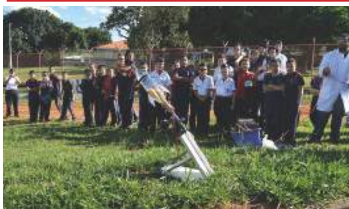
Alunos acompanhando o lançamento de foguetes