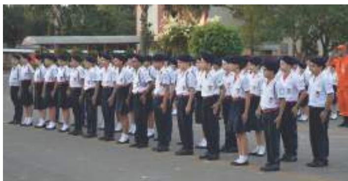
Em posição de destaque, alunos recebem premiação