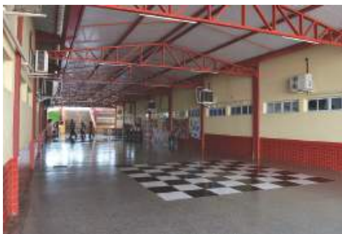
Pátio entre os blocos A e B