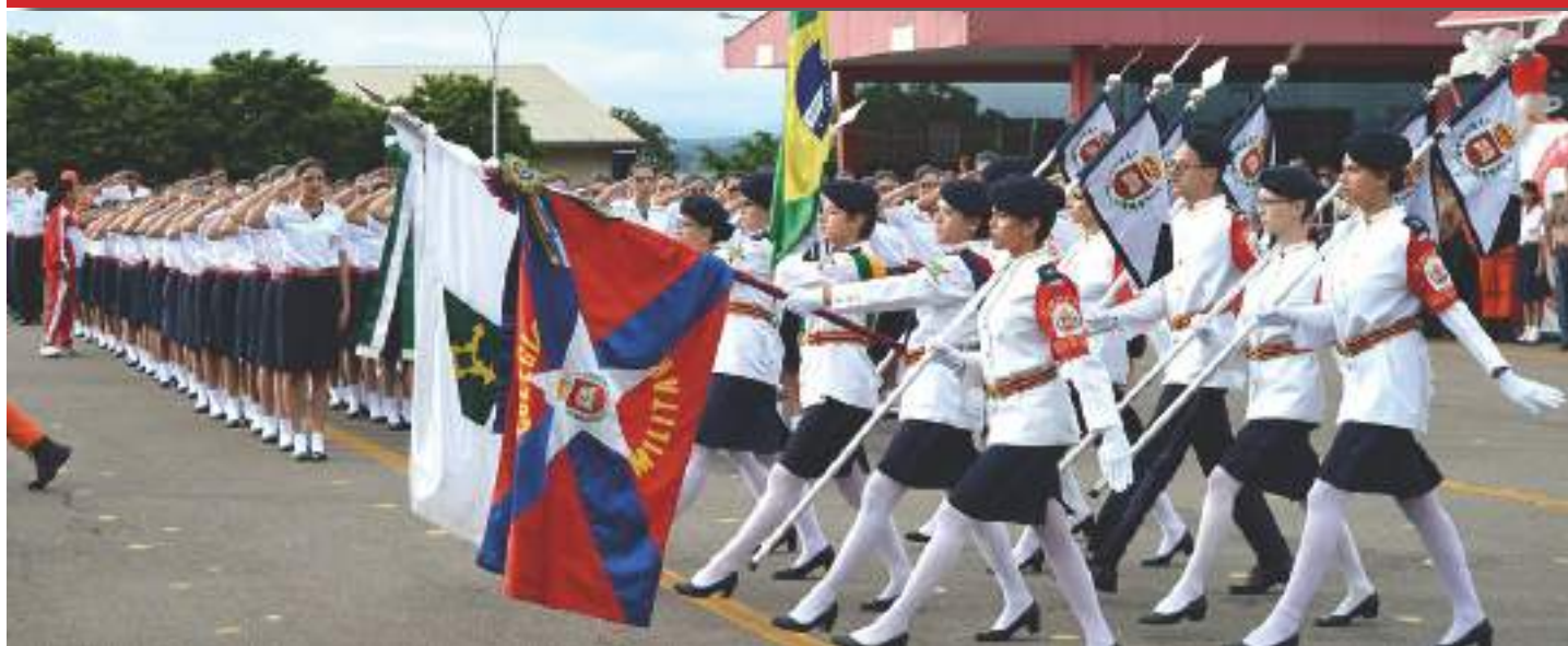
Incorporação do Pavilhão Nacional