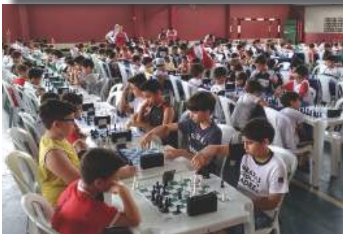
Etapa do campeonato de xadrez no CMDPII