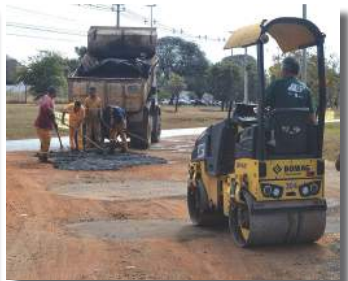
Recuperação de acesso ao estacionamento externo