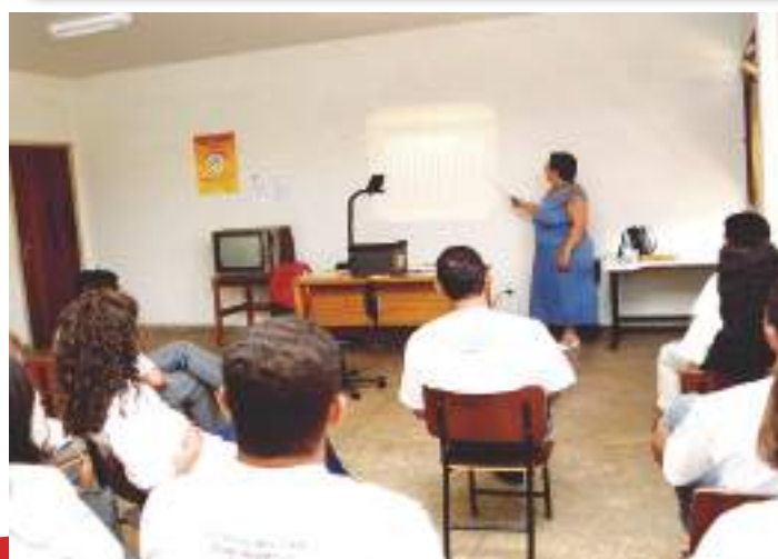
Sala de aula