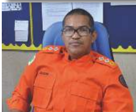
Subcomandante do CMDP II