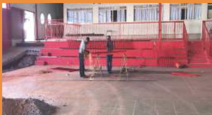
Construção do Guarda-Corpo da Ed. Infantil