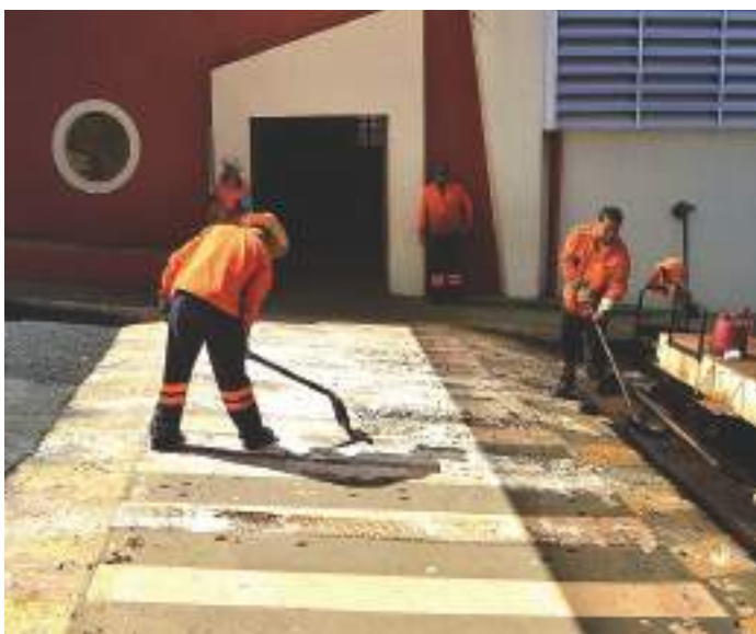
Passagem em frente à Educação Infantil