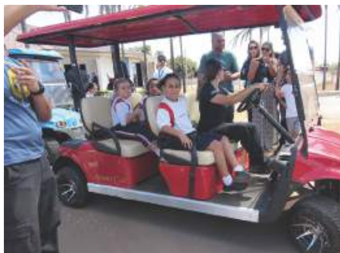
O passeio estava divertido