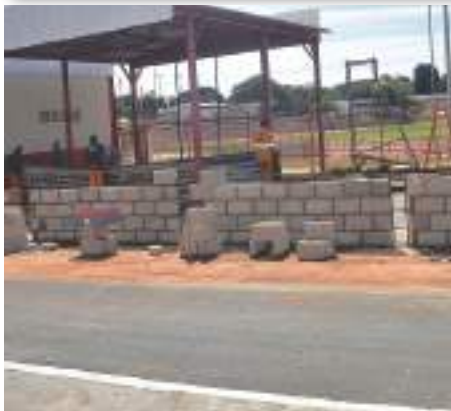
Nova área do parquinho da Educação Infantil