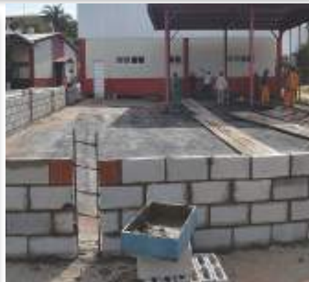
Outro ângulo do novo parquinho da Educação Infantil