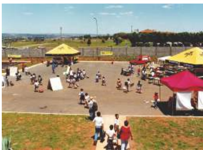
Pátio em frente ao prédio administrativo