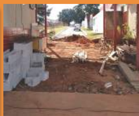
Construção de novo espaço de atendimento aos pais