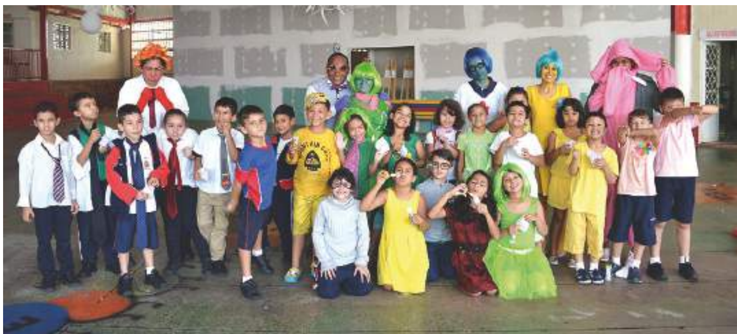
Profissionais do SOEPAS trabalhando conceitos das emoções com os alunos

O Mundo Dom Pedro acontece anualmente no CMDPII e consiste em simulações e modelos desenhados pela Organização das Nações Unidas - ONU. Eventos como este servem para melhorar a oratória do aluno e agregar novos conhecimentos aos jovens, podendo futuramente influenciar até mesmo na escolha profissional.