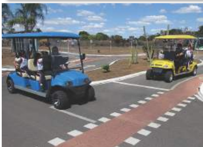
Minicidade do DER

No dia 31 de julho de 2018, o Departamento de Estradas e Rodagens (DER – DF) recebeu os alunos do 1º ano do Ensino Fundamental na Escola Vivencial de Trânsito – Transitolândia (minicidade de trânsito com regras da legislação vigente) -, cujo projeto educativo visa sensibilizar os alunos para questões relacionadas ao trânsito. O DER disponibiliza recursos pedagógicos para situações cotidianas de trânsito que podem ser vivenciadas numa “cidade-modelo”. A transitolândia tem como referência projetos de educação para o trânsito desenvolvidos na Escócia, Holanda, Alemanha e Estados Unidos, onde ficou constatado que tais iniciativas, de fato, tornaram o trânsito mais seguro, formando pedestres mais conscientes.