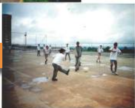
Quadra de esportes