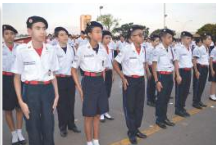
Valorização da excelência