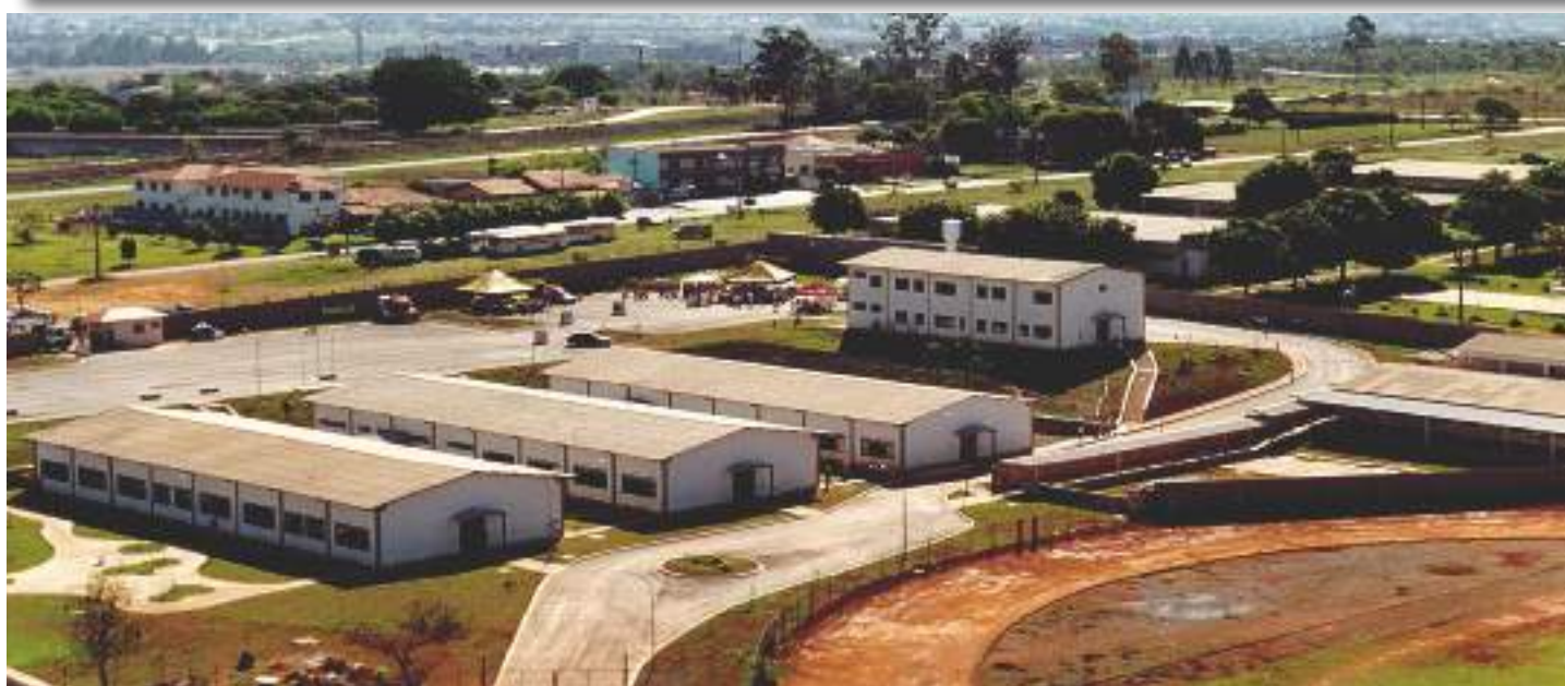
Vista aérea do CMDPII

Para compreender o atual momento do CMDP II, é necessário conhecer a sua história e perceber as decisões que foram tomadas ao longo dos anos. Com 18 anos de existência, o CMDPII se orgulha do caminho trilhado e não esquece do seu desafiador começo. Observe algumas fotos antigas que contam a nossa história.