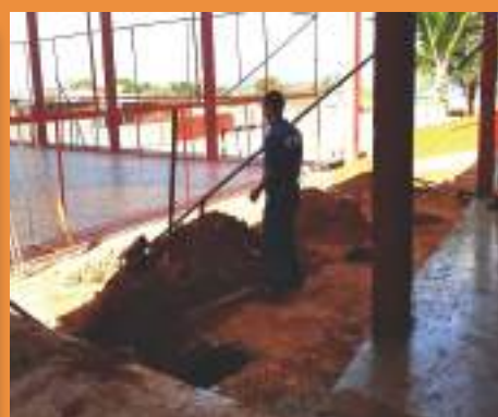
Constr. de banheiros masculinos, femininos e para deficientes físicos