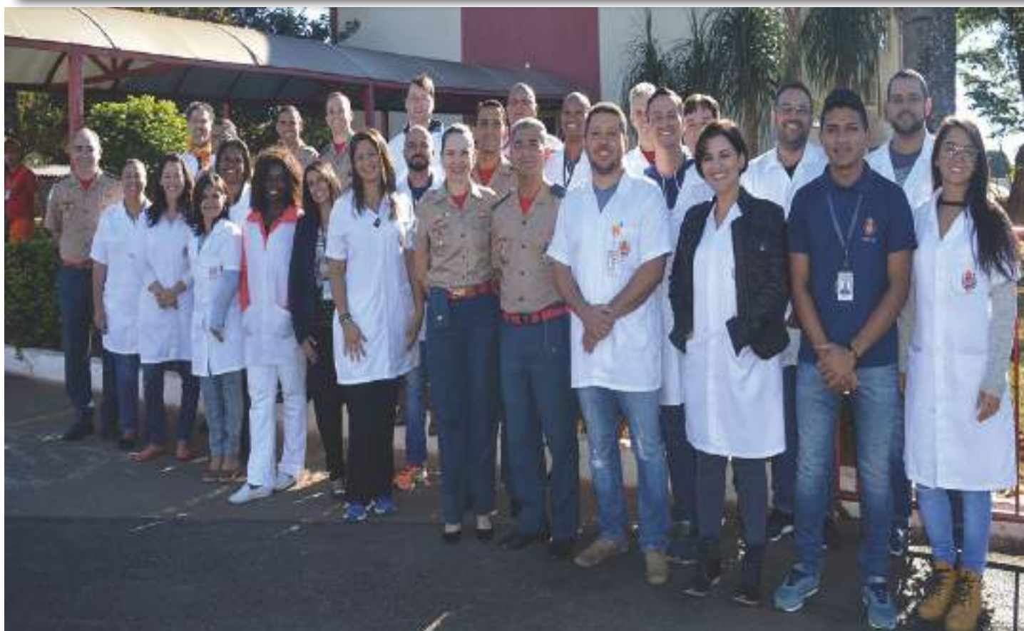
Coordenadores e professores do ensino Médio