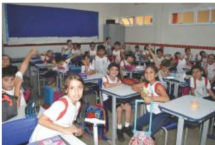
Sala de aula Ensino Fundamental