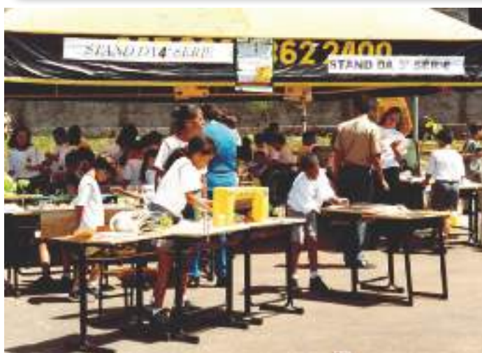
Trabalhos dos alunos