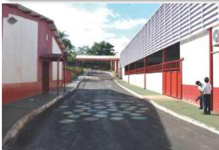
Entrada da Educação Infantil