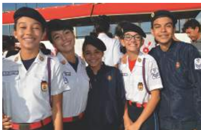
Alunos com excelentes médias de notas

O Comando do CMDPII, o Departamento de Ensino e seus respectivos professores parabenizam os alunos aprovados e desejam grande êxito nesta nova jornada acadêmica. O esforço individual de cada discente, aliado com um ensino comprometido com a excelência, é ferramenta fundamental para a transformação da sociedade. Acreditamos que os nossos valores que promovem a ordem, a disciplina e o ensino de qualidade serão reverberados na continuidade da vida acadêmica e no processo de transformação social.