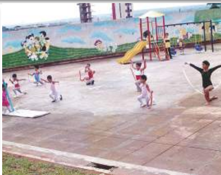
Parquinho da Educação Infantil