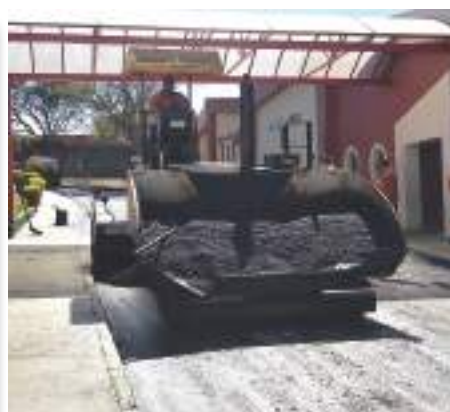
Troca do asfalto