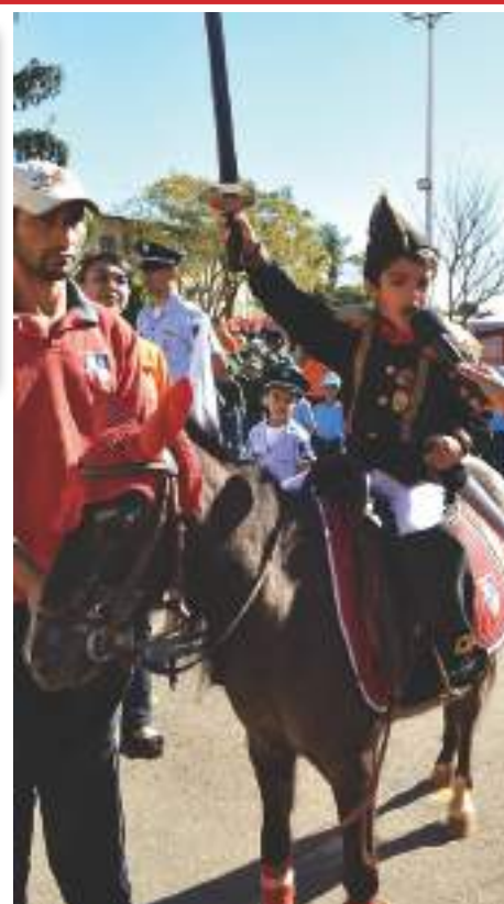
Aluno representa Dom Pedro

do Colégio de pais emocionados e cheios de orgulho. O grito “Independência ou Morte!”, eternizado por Dom Pedro, foi novamente proclamado por um aluno que adentrou a formatura e lembrou a célebre frase. Os alunos cantaram o Hino da Independência, deixando vários adultos que não conheciam a letra corados de vergonha. Ao final, desfilaram em continência ao Tenente-Coronel e Comandante do CMDPII, Wender Camico.