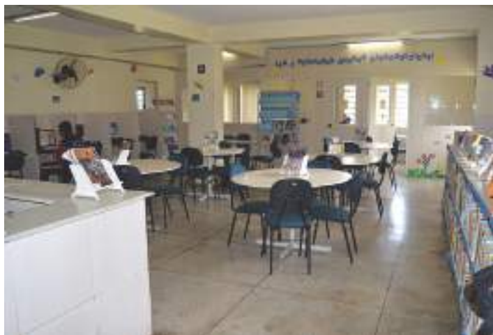
Parte interna da Biblioteca