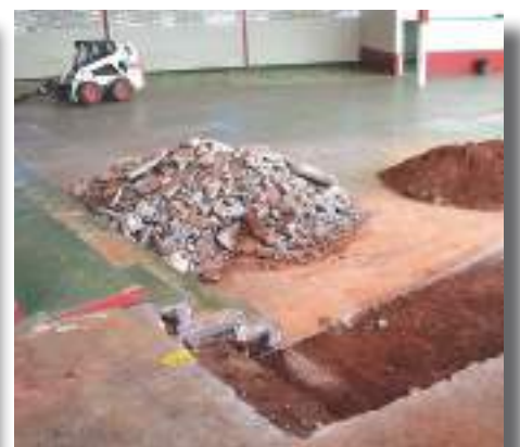
Reforma de rampa interna da Educação Infantil