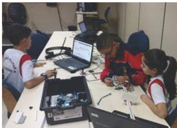
Alunos aprendendo na prática

vos e criativos para o longo da sua vida escolar e profissional. A Robótica Educacional também propiciará, pelo uso e aplicabilidade das ferramentas necessárias, trabalhar competências importantes para o desenvolvimento psicomotor e cognitivo, ampliando a capacidade de raciocínio lógico e de uma aprendizagem inspiradora, envolvente e eficaz.