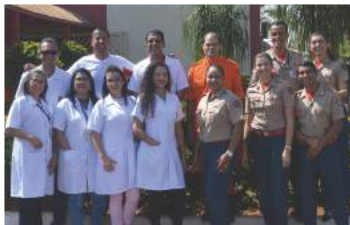
Equipe do turno vespertino