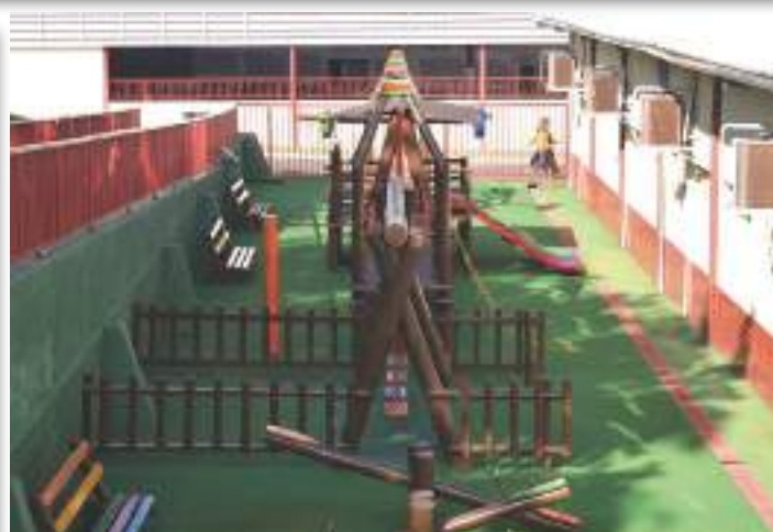
Parquinho do 2º ao 5º ano