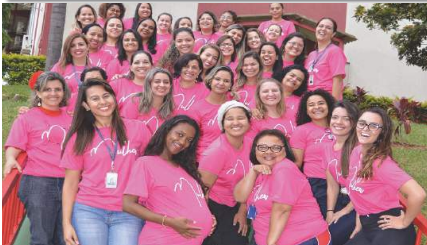
Equipe do 2º ao 5º ano: alegria e disposição constantes