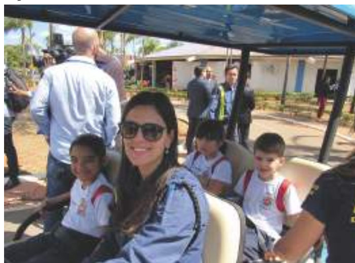
Alunos aprendem, na prática, as normas de trânsito