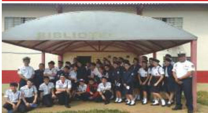
Alunos voluntários do Concurso de Redação

Sim. Acredito que esses fatores estão diretamente ligados entre si, pois, para obter um ótimo ensino é necessário estabelecer um conjunto de regras e segui-lo com disciplina, algo que o CMDPII obtém êxito em cumprir todos os dias com os discentes.