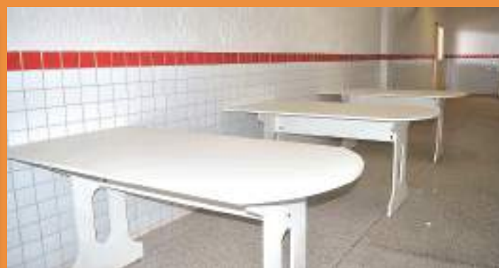
Mesas de estudo