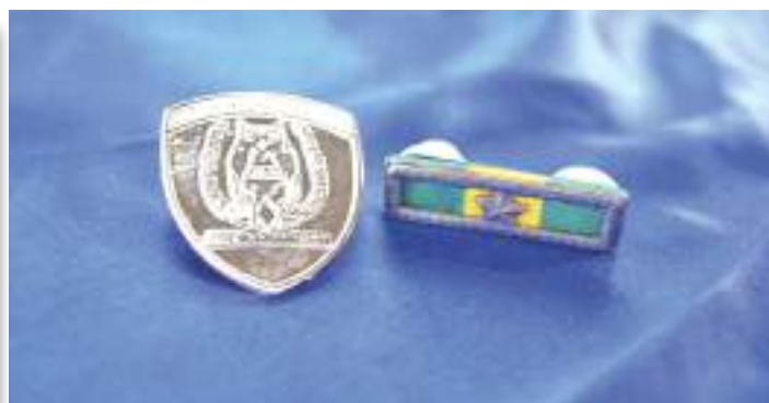
Brevê e Barreta