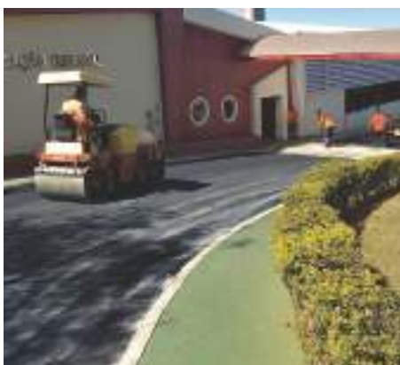
Troca do asfalto