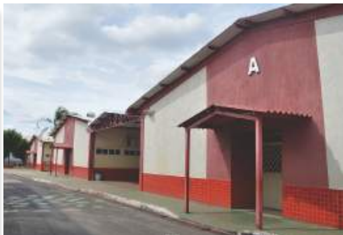
Blocos A, B e C