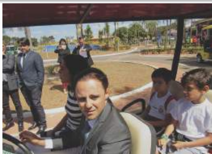
O piloto Felipe Massa e os alunos da Educação Infantil

O objetivo do projeto é promover a segurança e a humanização do trânsito, nas vias do DF, por intermédio de atividades pedagógicas elaboradas de forma lúdica, que envolvem conhecimento teórico e prático. Nesse sentido, o projeto tem o propósito de levar as crianças à participação e à reflexão sobre o seu papel no trânsito. As atividades propostas são: atividades lúdico-pedagógica, contemplando assuntos pertinentes ao trânsito seguro; jogos educativos; e experiência vivencial na minicidade de trânsito.