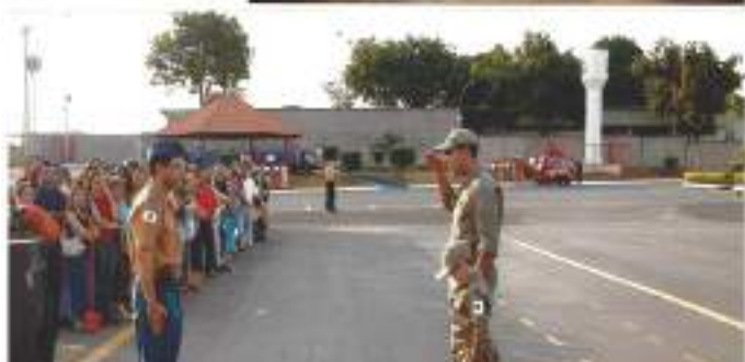
Formatura com a presença da comunidade escolar