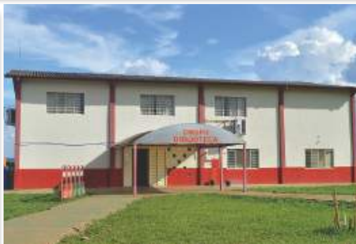
Parte externa da Biblioteca