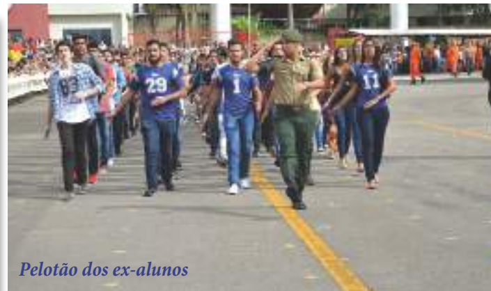
Pelotão dos ex-alunos