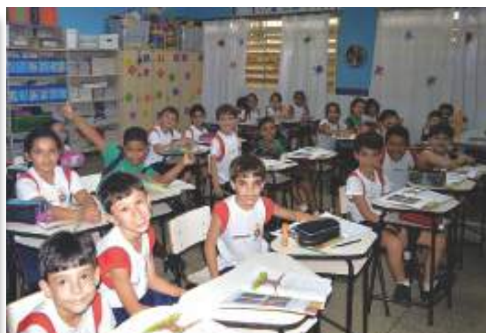
Sala de aula da Educação Infantil