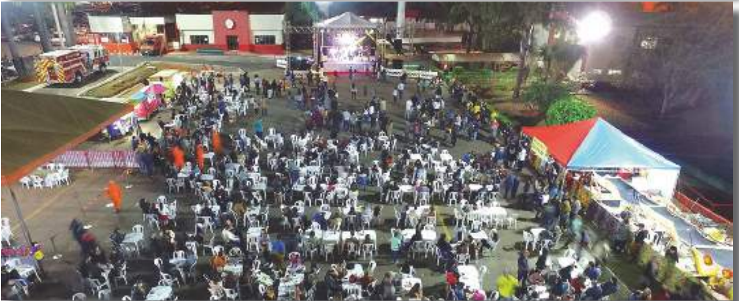
O pátio principal do CMDPII cercado de barracas de comidas típicas e o show principal com a banda Brazilian Band

Nos dias 27 e 28 de julho, aconteceu a tradicional Festa das Regiões do CMDPII. O evento foi um sucesso absoluto, pois contou com a participação maciça da comunidade escolar que foi conferir as apresentações de danças típicas das regiões do Brasil protagonizadas pelos alunos e o show da banda Brazilian Band. A criançada também se divertiu com as brincadeiras e brinquedos infláveis. Os participantes puderam ainda degustar comidas típicas nas diversas barracas de alimentos e nos food trucks presentes. Foi uma noite muito animada, em que alunos, pais, tios, avós e toda a família do CMDPII aproveitaram para dançar e celebrar.