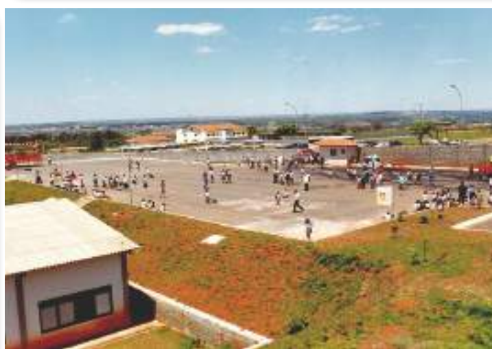
Pátio principal do CMDPII