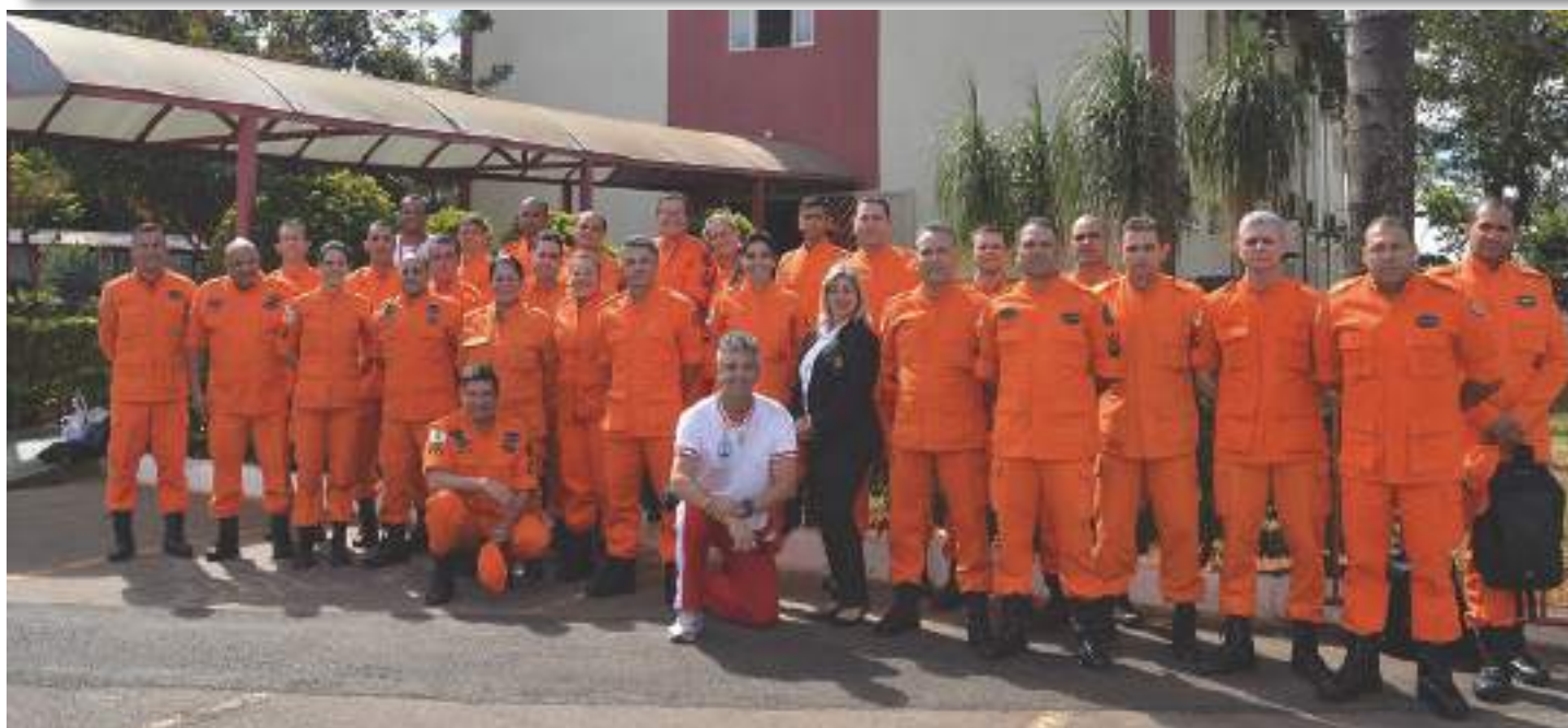
Equipe do Turno Matutino do Corpo de Alunos