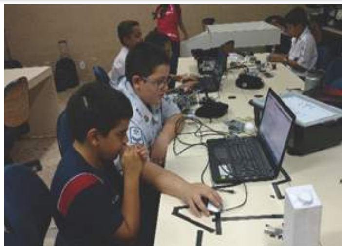
Auxilia no desempenho pessoal e profissional

A Robótica Educacional contribuirá para a desenvolvimento de habilidades acadêmicas para o século XXI como estimular o pensamento crítico, incentivar habilidades criativas de resolução de problemas em uma variedade de temas da vida real, formando alunos ativos, colaborati-