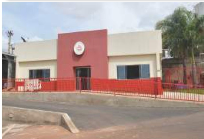
Banda de Música