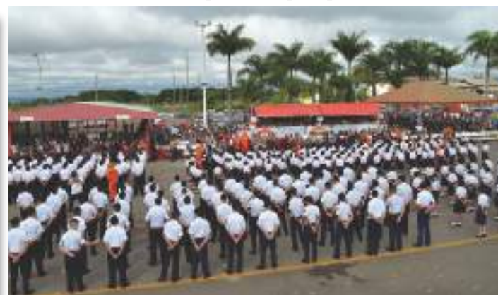
Tropa em forma