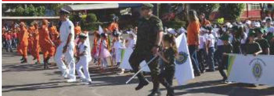
Tropas infantis representam as Forças Armadas e Forças Auxiliares