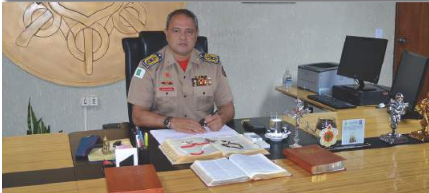
Gabinete do Comando Geral do CBMDF