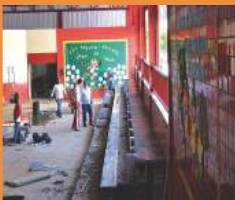
Arquibancada da Educação Infantil