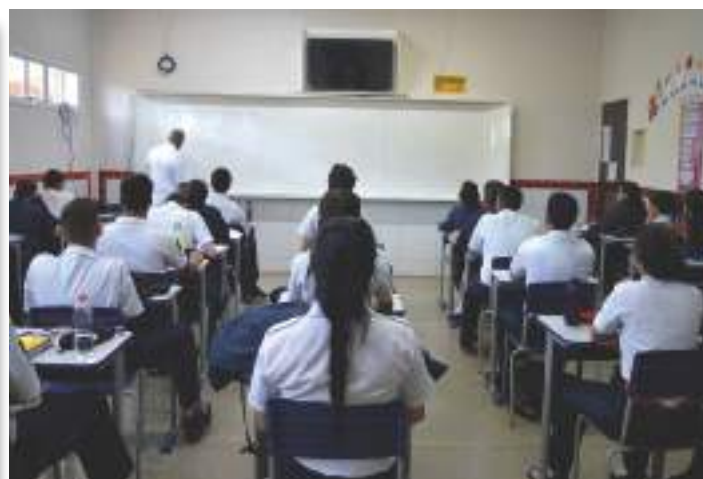
Sala de aula Nível Médio