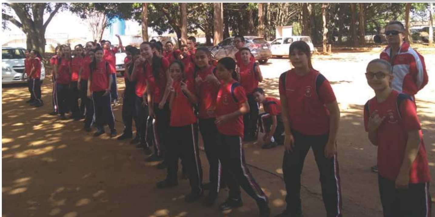
Atividade guiada na Estação de Tratamento de Água de Brasília