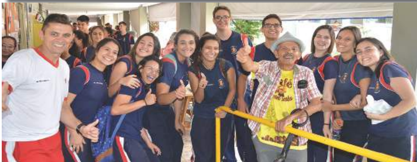
Grande lição de solidariedade