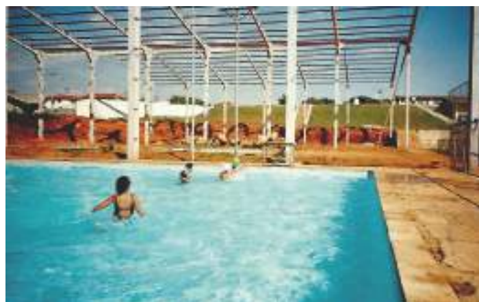
Construção de quadra coberta