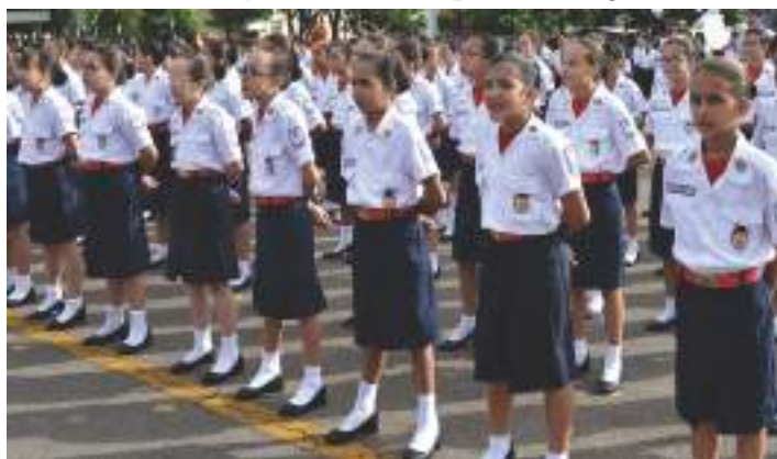
Alunas preparadas para receber a Boina

6º ano do Ensino Fundamental, pois passam a trajar a farda do CMDPII. O nome da “boina” remete a um dos principais acontecimentos históricos do Corpo de Bombeiros, quando 17 bombeiros perderam a vida num incêndio de produtos químicos existente na Ilha do Braço forte, situada na Baía de Guanabara (RJ), na década de 1950. A farda nos moldes dos uniformes militares que o aluno do Colégio Militar Dom Pedro II passa a usar simboliza a incorporação das tradições, dos valores culturais e éticos da instituição. Ao final do evento, os alunos desfilaram em continência ao Comandante do CMDPII. O fato curioso é que desfilam também os ex-alunos do CMDPII. Com sentimentos de gratidão e saudade, eles marcharam com imponência pelo pátio interno.