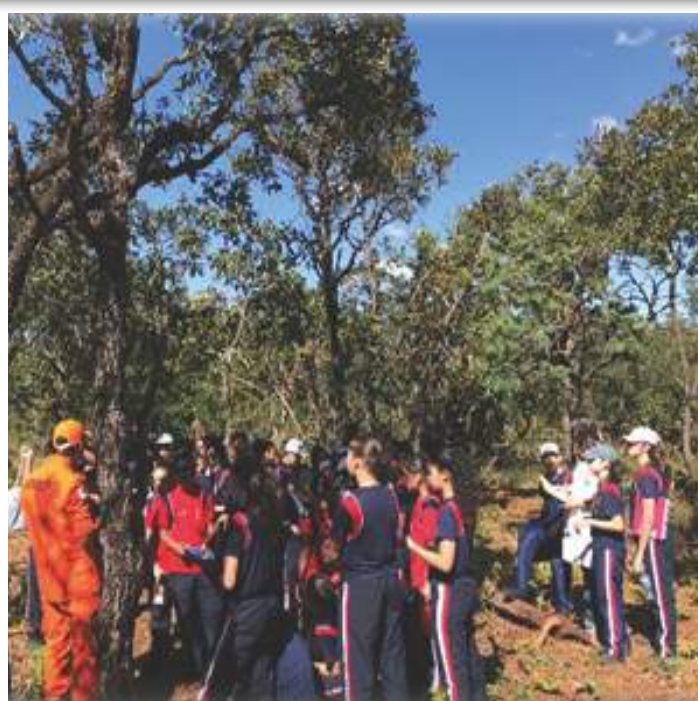
Bioma Cerrado sendo estudado pelos os alunos