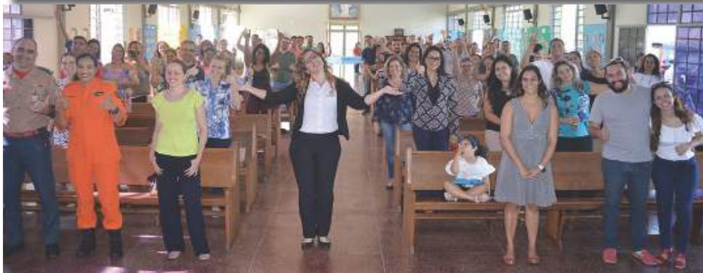
Encontro da Escola da Inteligência com a comunidade escolar