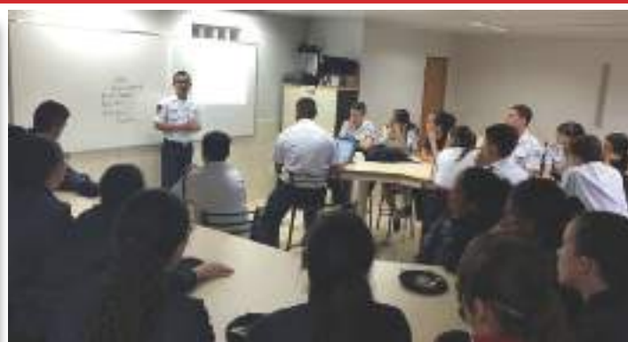
Militares da Marinha ministrando aula