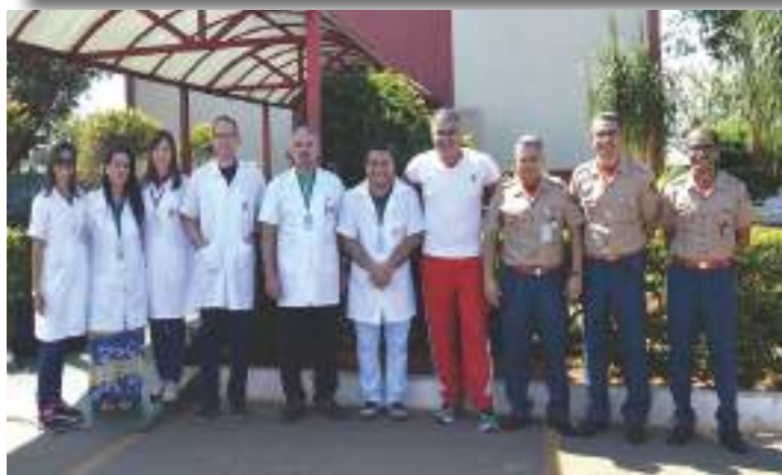
Equipe do turno matutino