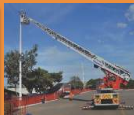
Colocação de lâmpadas de LED