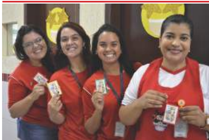
Equipe da Sala de Leitura

A STE também elabora o calendário Escolar e confecciona as avaliações para o processo seletivo e ingresso de novos alunos no CMDP II, além de apoiar nos sorteios de vagas para o Ensino Infantil, que são realizados anualmente.