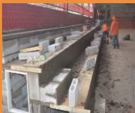
Construção de arquibancada na Educação Infantil